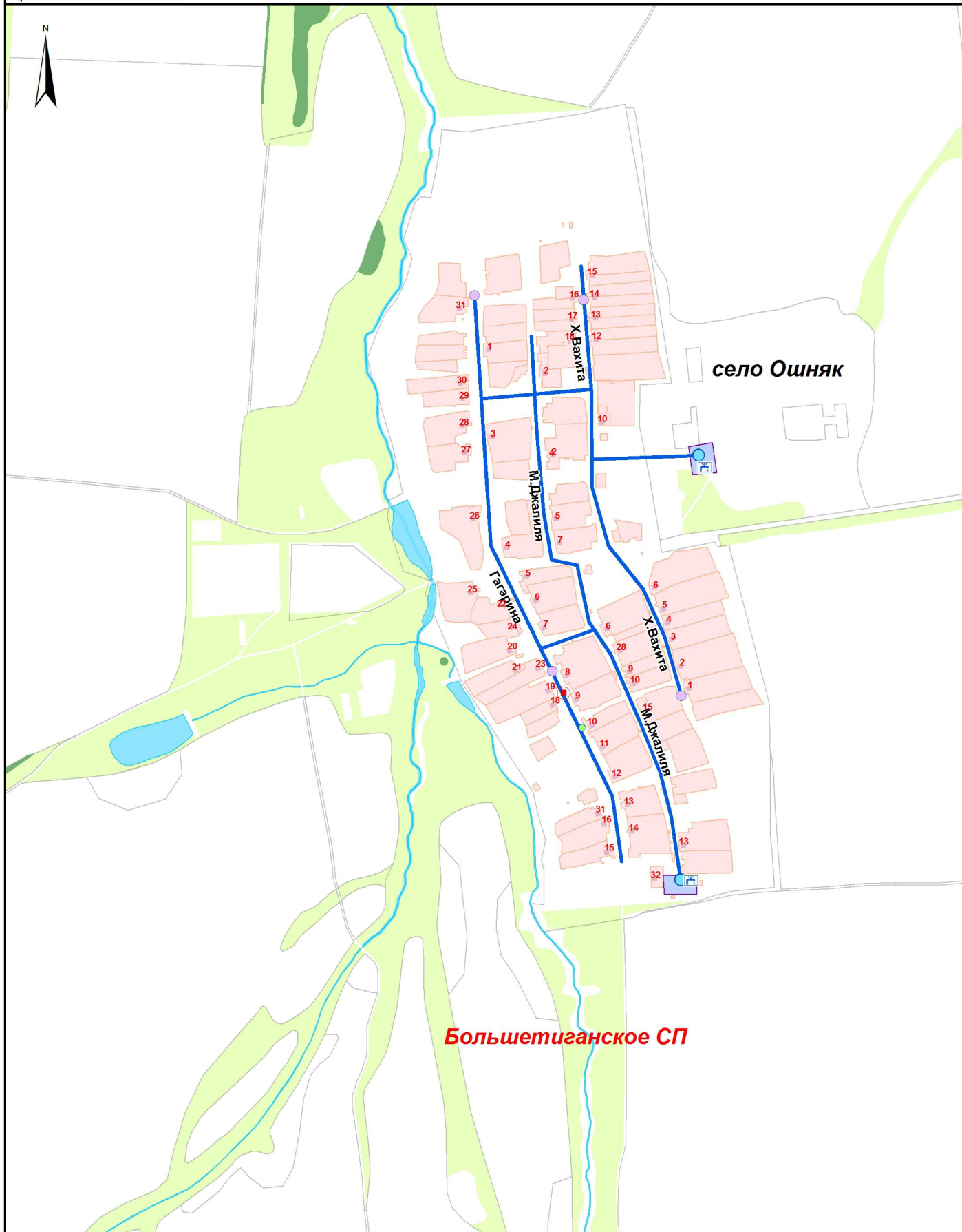
Схема водоснабжения Большеветиганского сельского поселения Алексеевского муниципального района РТ Фрагмент 2. с. Ошняк